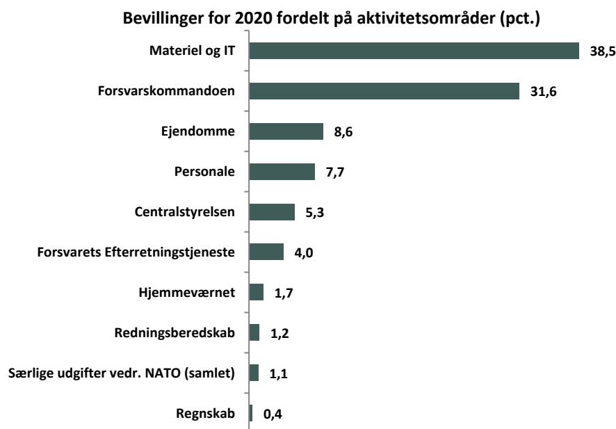
Tabel 3: Oversigt over Forsvarsministeriets bevillinger i 2020 fordelt på budgetområder (mio. kr.)